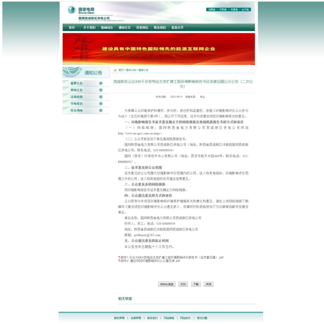
图 3.1 环境影响评价第二次信息公示（网络）