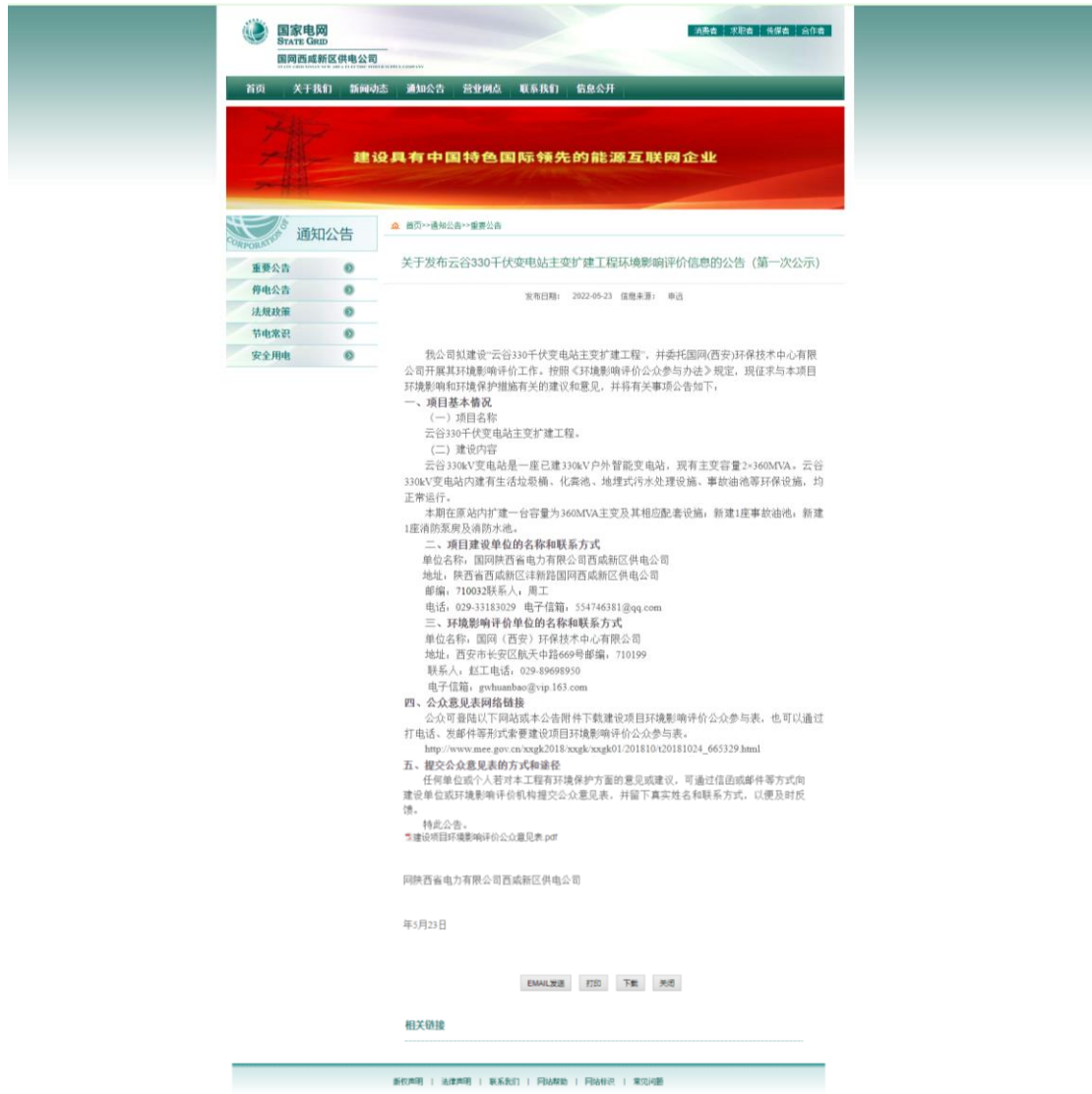
图 2.1 环境影响信息首次公示情况