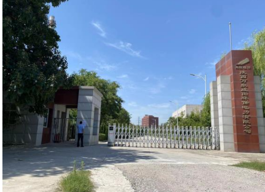
2 陕西万泉咸阳环保电力有限公司