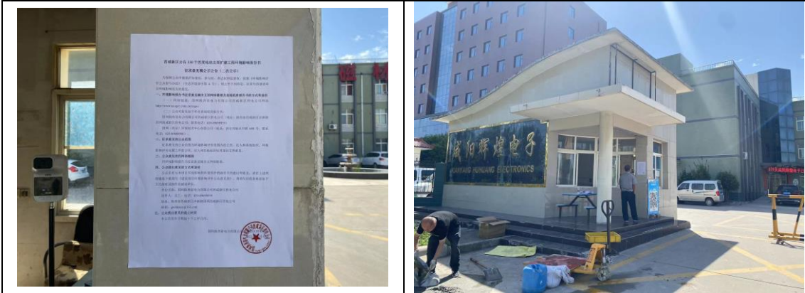
4 咸阳辉煌电子 图 3.4 现场张贴