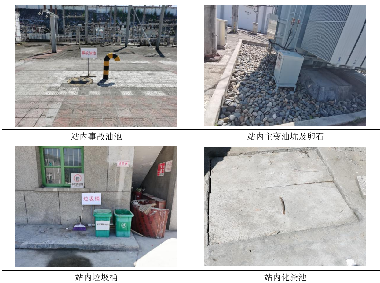
图 6-2 汉阴 110kV 变电站环保设施情况