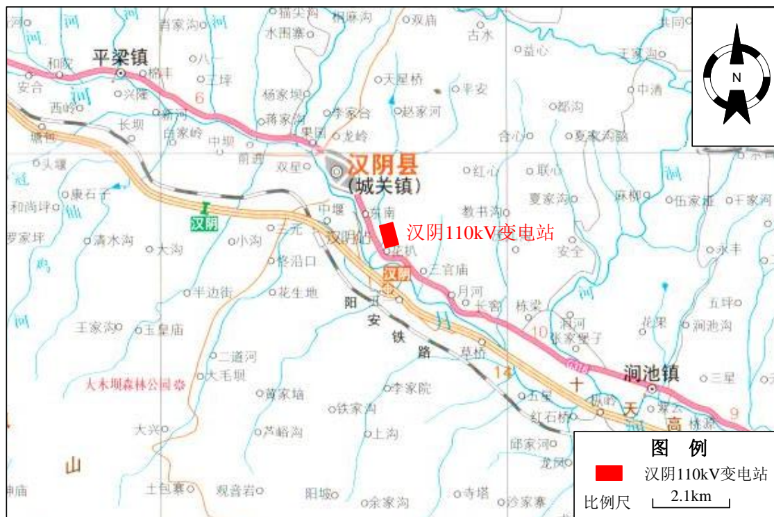
图4-1 本工程地理位置示意图