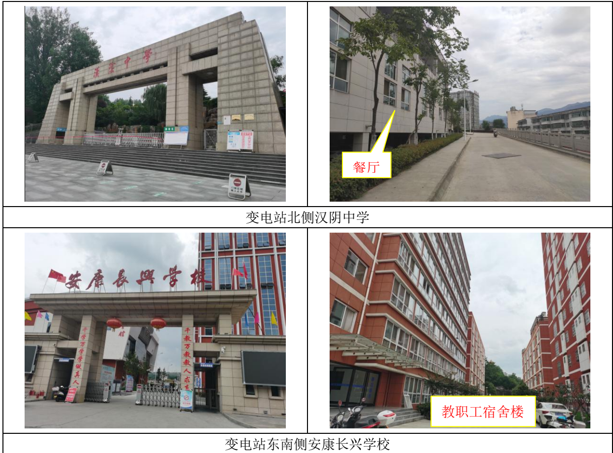
图 2-1 环境保护目标与变电站位置关系示意图