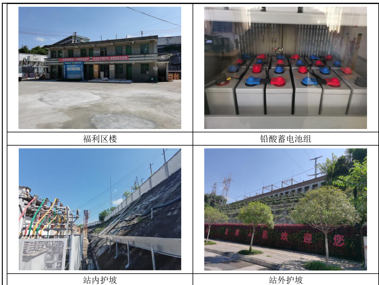
图 4-3 汉阴 110kV 变电站站区照片