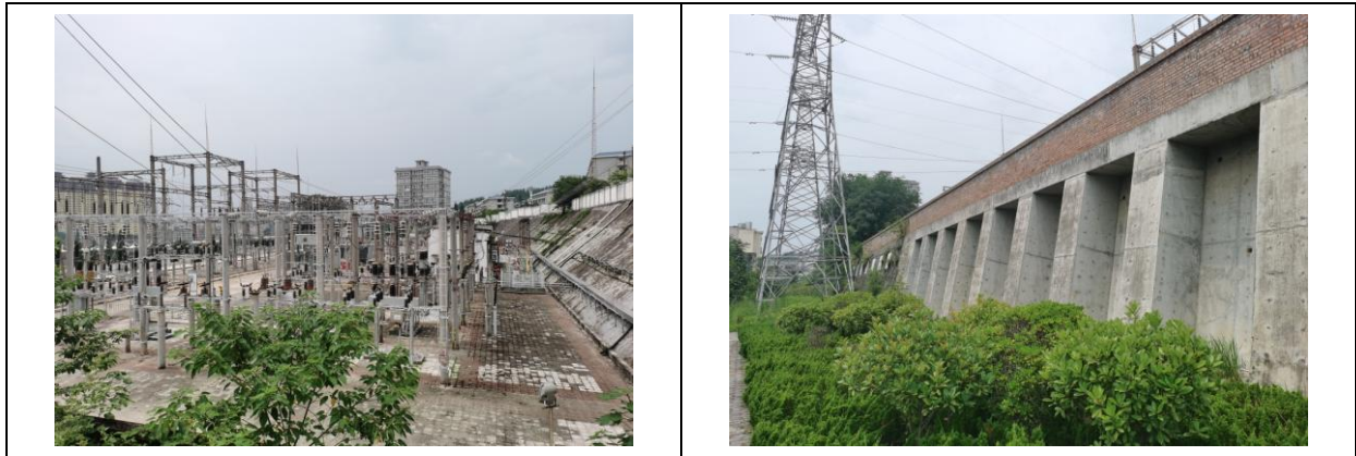
图 6-1 汉阴 110kV 变电站环境状况