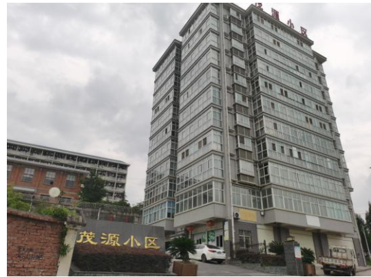
变电站北侧茂源小区