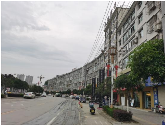
变电站北侧花扒村