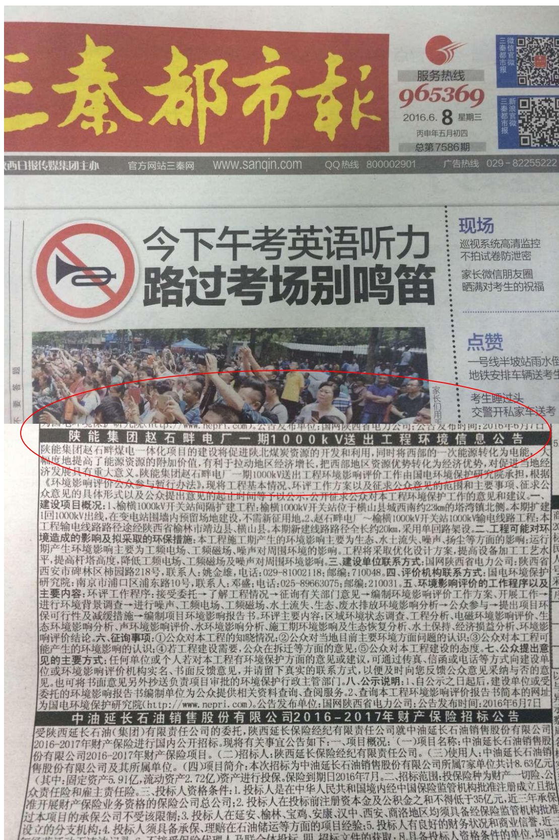
图 9.1 本工程环评第一次公示