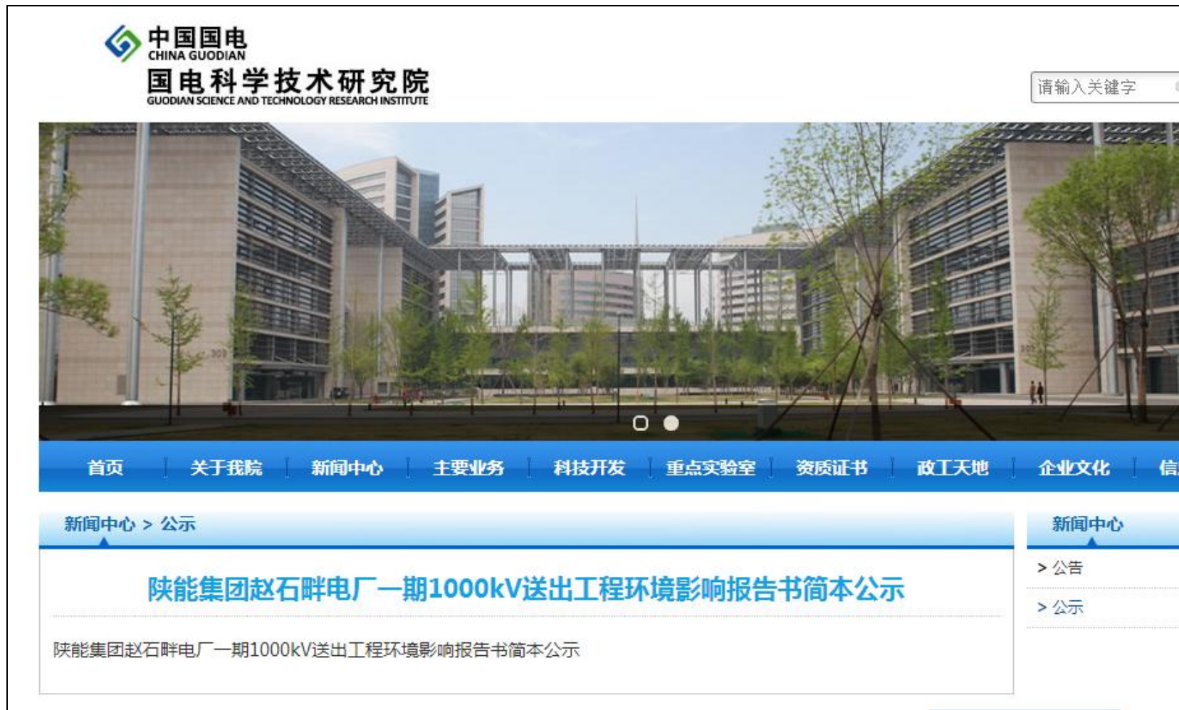
图 9.2 本工程环境影响报告书简本链接截图