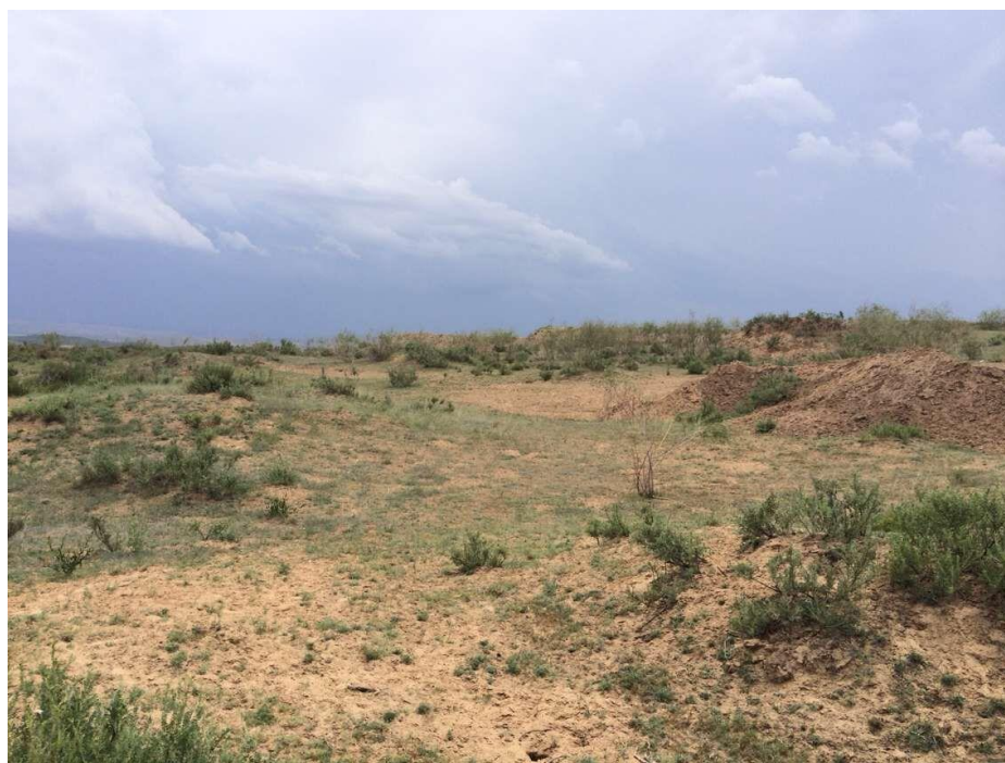
图 6.7 跨越点附近周围环境情况

本工程输电线路在榆横 1000kV 开关站进线段平行于拟建的赵石畔电厂至榆横变 1000kV 输电线路走线，两平行线路之间最短距离约为 100m，并行线路位于山坡上，并行线路间无环境保护目标，因此不存在对环保保护目标的综合影响。